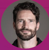
ARNE FRIEDRICH , ehemaliger Fußball Nationalspieler, Stiftungsgründer, Podcaster